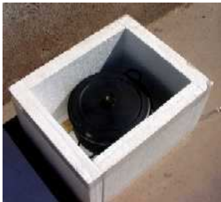
Olla bruja de telgopor con la olla dentro. La olla apoya en una madera, pero no tiene aún el aluforro de aluminio por el interior.

El tamaño de la olla para colocar adentro debe ser tal que permita el cierre perfecto de la caja, además se debe tratar de contar con una olla con manija de aro de alambre, será más cómoda en el momento de extraerla. Una medida interesante es comprar telgopor de 30 cm x 40 cm x 5 cm de espesor en cantidad 6, una para la tapa y las otras para pisos y paredes de la caja. Debería quedar como la figura siguiente.