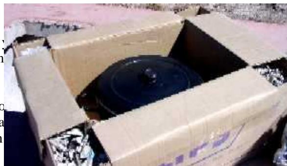
Olla bruja de cartón con la olla dentro.